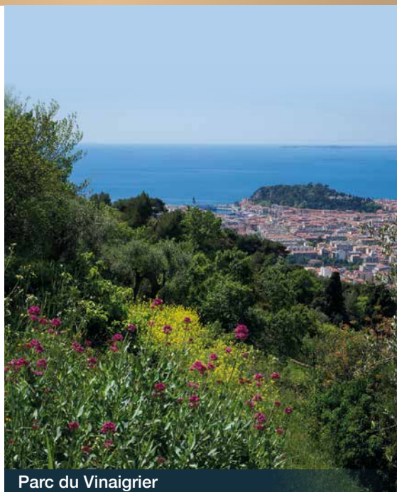
Parc du Vinaigrier