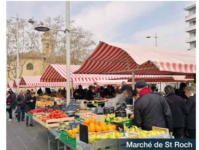
Marché de St Roch